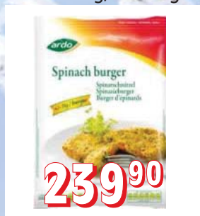
ŠPENÁTOVO-SÝROVÉ ŘÍZEČKY 10 × 1 kg, kus 75 g