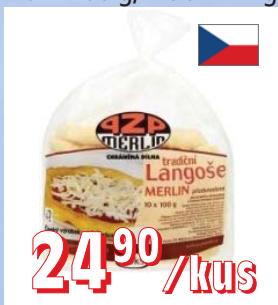
LANGOŠE MRAŽENÉ 10 × 100 g, krt 6 × 1 kg