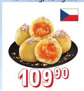
TVAROHOVÉ KNEDLÍKY S MERUŇKAMI 12 × 1 kg, 12 kg/krt