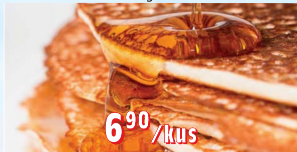
PALAČINKY 100 × 50 g, 5 kg/krt