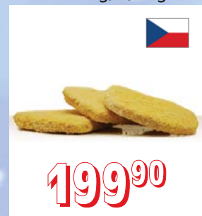
OBALOVANÝ SÝR nedrcený, nepředsmáž. 40 × 100 g, 4 kg/krt 40 × 130 g, 5,2 kg/krt