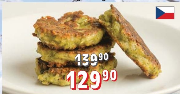
OBALOVANÉ BROKOLICOVÉ KARBANÁTKY 80 g, 3,6 kg/krt