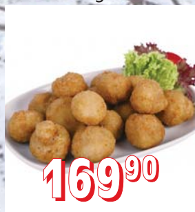
OBALOVANÉ ŽAMPIONY 5 kg/krt