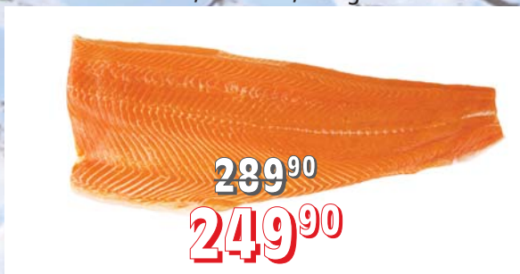
LOSOS PACIFICKÝ FILET s kůží, bez kostí, 10 kg/krt