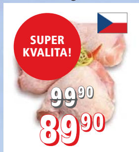
KUŘECÍ ŠPALÍČKY ČR 12 kg/krt