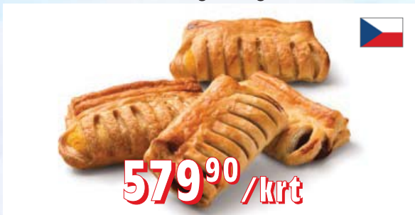
HŘEBEN TVAROH, OŘECH, MERUŇKA, PUDING 80 × 65 g, 5,2 kg/krt