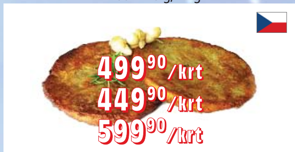
BRAMBORÁKY ČR – 20 × 200 g – kapsa – 60 × 60 g, 3,6 kg – 100 × 40 g, 4 kg