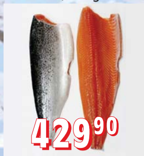
LOSOS NORSKÝ TRIM D s kůží, 10 kg/krt