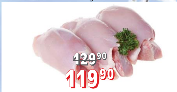
KUŘECÍ STEHENNÍ STEAK 6 × 2 kg, 12 kg/krt