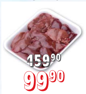
KACHNÍ JÁTRA 500 g, 15 kg/krt