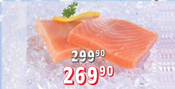
LOSOS PACIFICKÝ PREMIUM porce 50 × 100 g, 5 kg/krt porce 50 × 150 g, 7,5 kg/krt