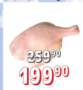
KACHNÍ STEHNA 250–300 g, 2 ks, vak. baleno, 12 kg/krt