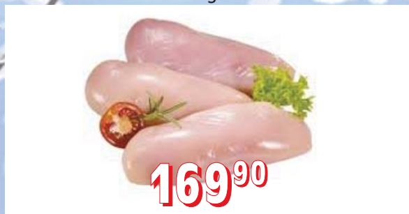
KUŘECÍ PRSA NATURAL 4 × 2,5 kg, 10 kg/krt