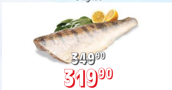
CANDÁT FILET s kůží, mraženo zvlášť, 5 kg/krt