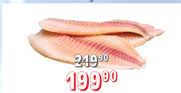
TILÁPIE FILETY bez vody, kostí a kůže, EXTRA kvalita, 5 kg/krt