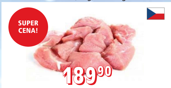
KRŮTÍ NA ČÍNU Farma Zelenka ČR, balení cca 2,5 kg, cca 20 kg/krt