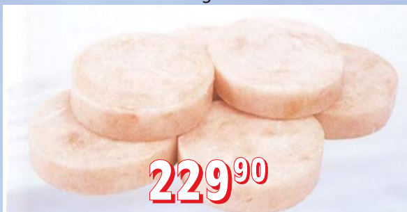
HEJK MEDAJLONKY 75, 100 g, 6 kg/krt