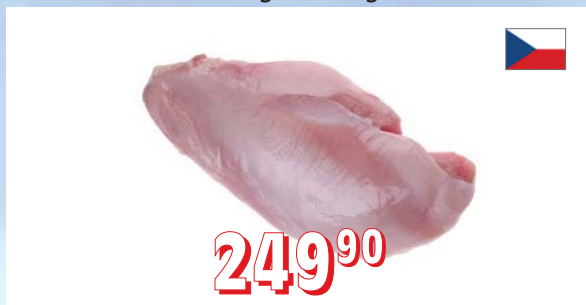
KRŮTÍ PRSA NATURAL Farma Zelenka ČR, cca 3 kg/ks, 20 kg/krt