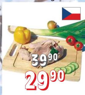
KUŘECÍ DÍLY NA POLÉVKU ČR cca 10 kg/krt