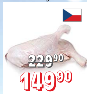
KACHNÍ ČTVRTKY ZADNÍ B 10 kg/krt