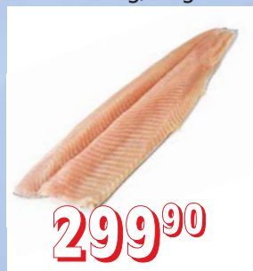
PSTRUH FILETY s kůží, 20 %, IQF, 100–150 g, 5 kg/krt