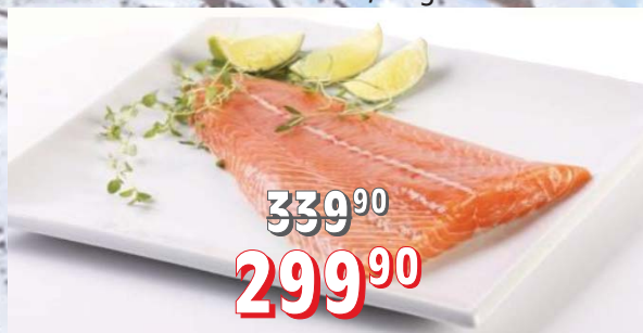
LOSOS PACIFICKÝ FILET bez kůže a kostí, 5 kg/krt