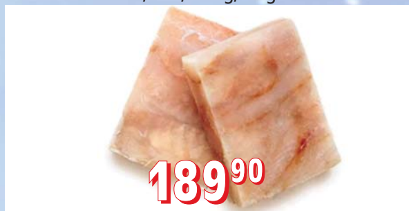
HEJK PORCE PREMIUM bez kostí, vody, aditiv, 100, 120, 150 g, 6 kg/krt