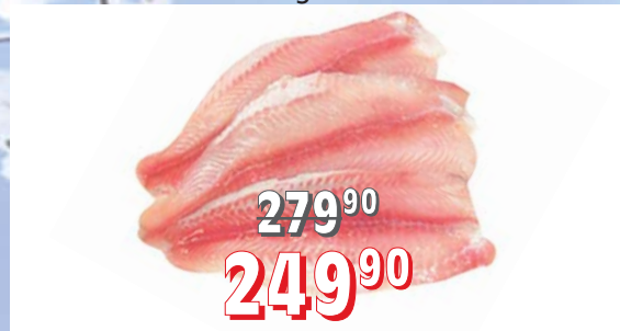
SUMEČEK AFRICKÝ filety bez kostí a kůže, 200–400 g, 5 kg/krt