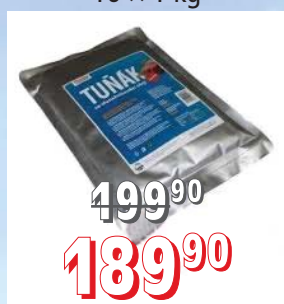
TUŇÁK PREMIUM ve slunečnicovém oleji 16 × 1 kg