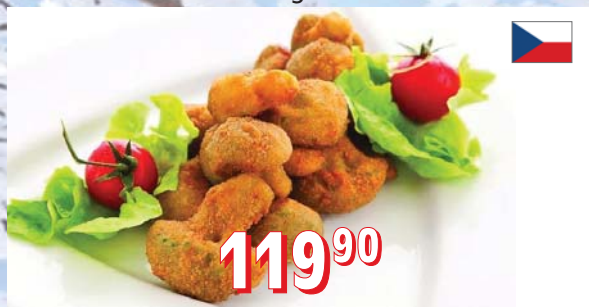
OBALOVANÁ BROKOLICE 5 kg/krt