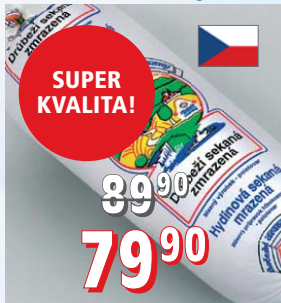
KUŘECÍ SEKANÁ 24 × 500 g