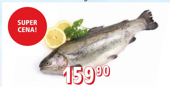
PSTRUH DUHOVÝ KUCHANÝ 200–250 g, 250–300 g, 5 kg/krt