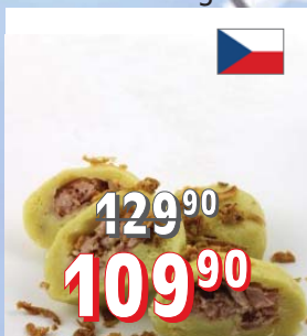
BRAM. KNEDLÍKY PLNĚNÉ UZ. MASEM 12 × 1kg