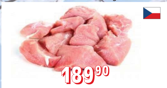
KRŮTÍ NA GULAŠ Farma Zelenka ČR, 5 kg/krt