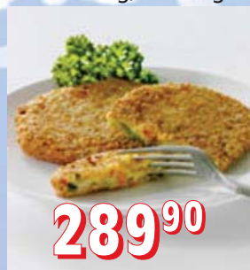
KVĚTÁKOVO-SÝROVÉ ŘÍZEČKY 10 × 1 kg, kus 75 g