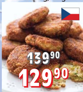
KARBANÁTKY ZELENINOVÉ 100 × 50 g, 5 kg/krt