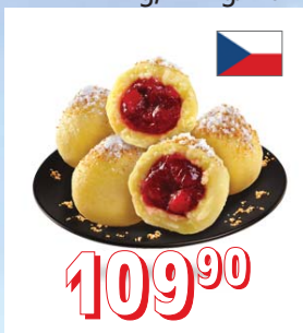
TVAROHOVÉ KNEDLÍKY S JAHODAMI 12 × 1 kg, 12 kg/krt