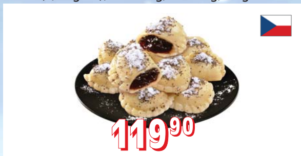
TAŠTIČKY S NÁPLNÍ MRAŽENÉ nepředvařené, jahodové, povidlové, tvarohové (4,5 kg/krt), 55 × 18 g, 6 × 1 kg, 6 kg/krt