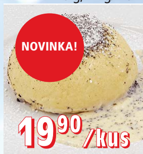
KYNUTÉ KNEDLÍKY S POVIDLÝ 24 × 170 g, 4 kg/krt