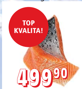
LOSOS NORSKÝ (SALMO SALAR) řezy z filetů, 100 g/ks, 4 kg/krt