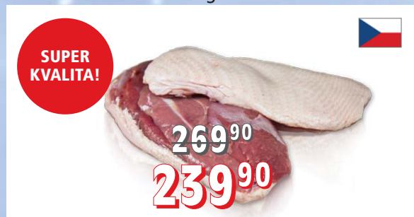
KACHNÍ PRSA S KŮŽÍ ČR 6 kg/krt