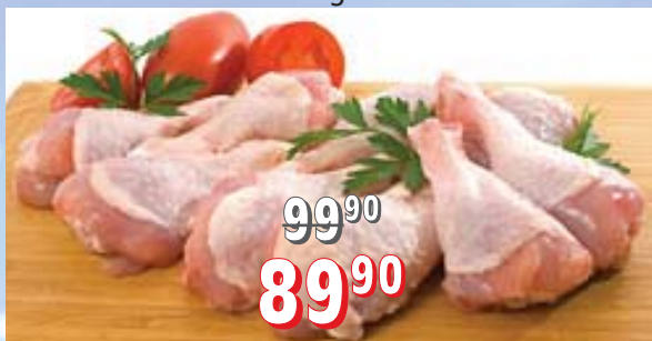
KUŘECÍ PALIČKY 10 kg/krt