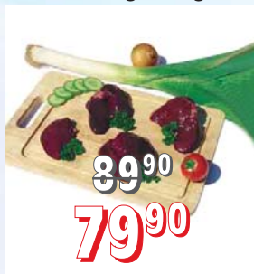
KRŮTÍ JÁTRA 30 × 0,5 kg, 15 kg/krt