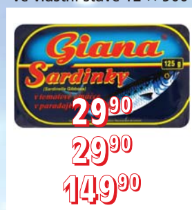
SARDINKY – v rajč. omáčce 24 × 125 g – v rostlin. oleji 24 × 125 g – ve vlastní šťávě 12 × 900 g