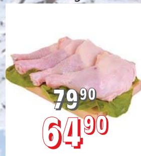
KUŘECÍ ČTVRTKY volně, cca 300 g, 10 kg/krt