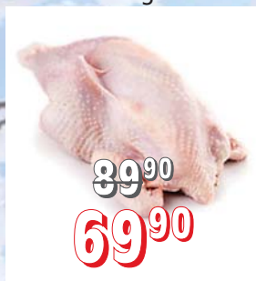
SLEPICE těžká cca 3 kg/kus