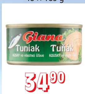
TUŇÁK DRCENÝ ve vlastní šťávě 48 × 185 g