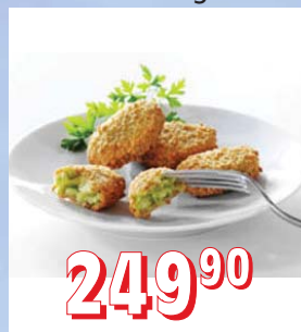
BROKOLICOVÉ NUGETY ARDO 6 × 1 kg