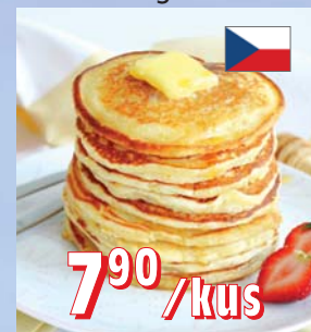
LÍVANCE ČR 100 × 40 g, 4 kg/krt