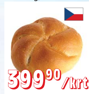
RAŽENKA NATURAL RAŽENKA CEREÁLNÍ 75 g, 70 ks/krt