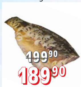
KAPR PŮLENÝ 5 kg/krt